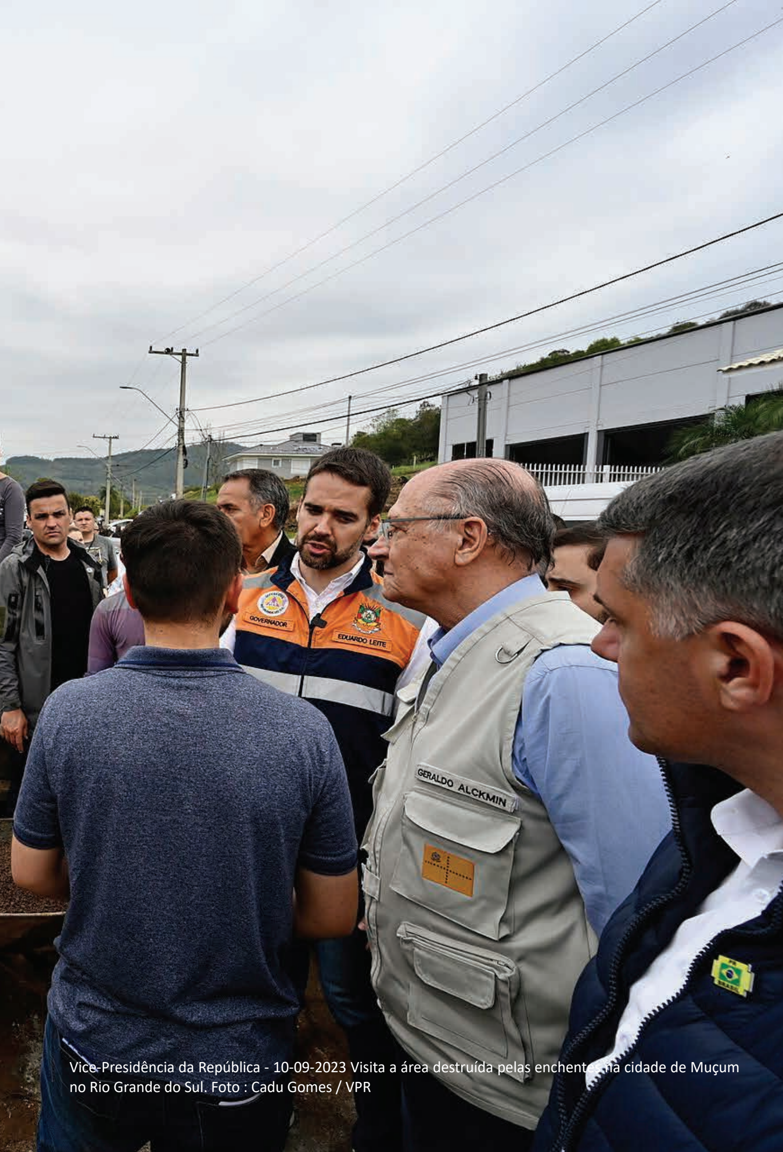
Vice-Presidência da República - 10-09-2023 Visita a área destruída pelas enchentes na cidade de Muçum no Rio Grande do Sul.