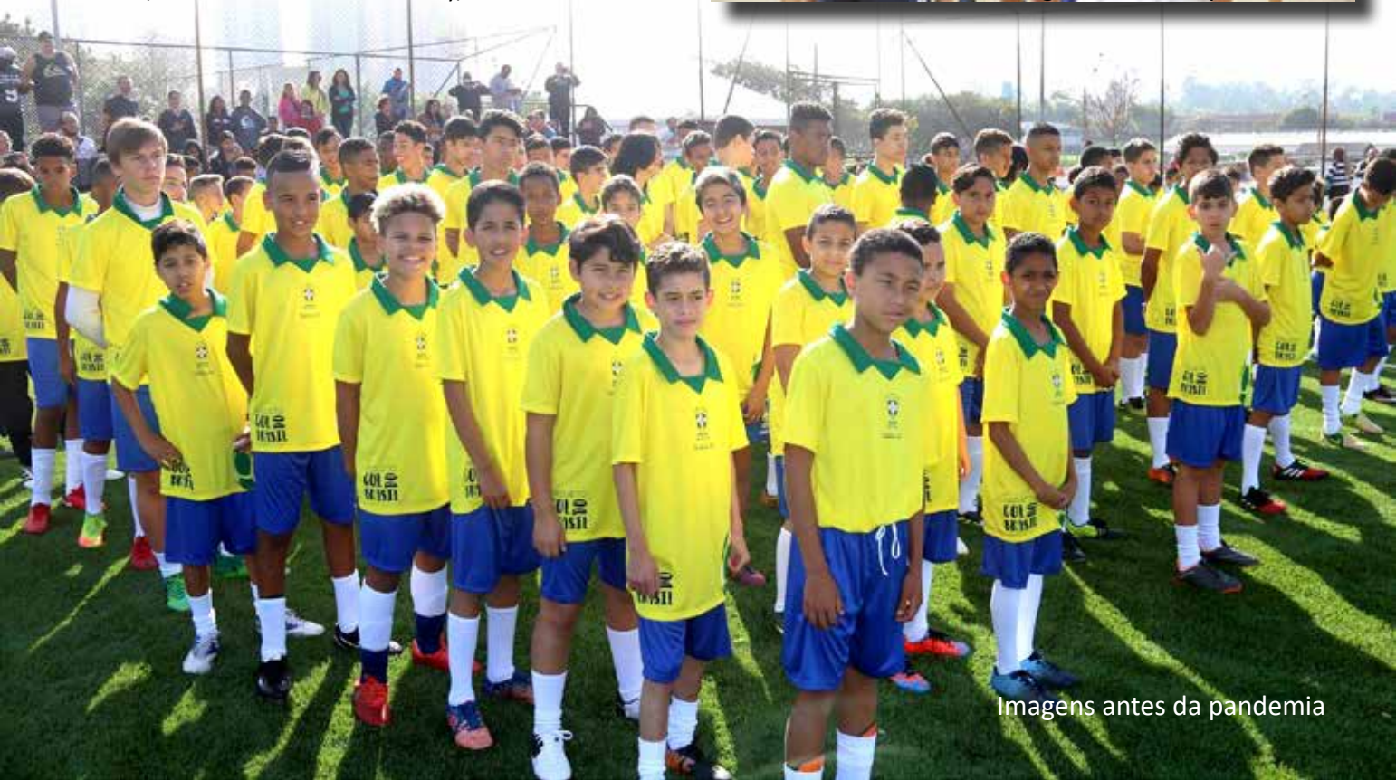
Imagens antes da pandemia