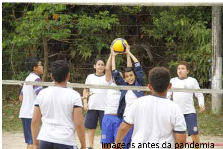
Imagens antes da pandemia

Outra parceria que deu certo, o projeto CBF Social, em conjunto com a Confederação Brasileira de Futebol, também beneficia cerca de 200 crianças na cidade. Os pequenos, além das aulas de futebol, participam de oficinas que enfatizam o companheirismo, a criatividade, os desafios críticos e o desenvolvimento de valores e cidadania.